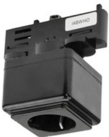
99-095-2 EUTRAC Steckdosen Multi-Adapter für 3-Phasen Aufbau und Einbauschiene, 50N - schwarz 99-095-2