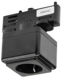
99-095-2 EUTRAC Steckdosen Multi-Adapter für 3-Phasen Aufbau und Einbauschiene, 50N - schwarz 99-095-2