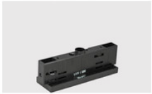
555 1 5203 2 EUTRAC Mitteneinspeiser für 3-Phasen Aufbauschiene und Einbauschiene - schwarz 555 1 5203 2