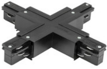
555 1 1216 2 EUTRAC X-Verbinder für 3-Phasen Aufbauschiene, mit Einspeisemöglichkeit - schwarz 555 1 1216 2