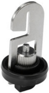
99-067-2 EUTRAC Haken für Stahlseile bis 2mm - schwarz 99-067-2