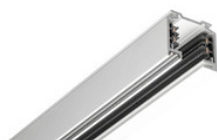
25-303 EUTRAC Stromschiene 3-Phasen Aufbauschiene 3000mm - silber 25-303