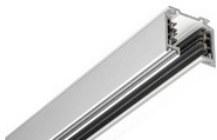
25-203 EUTRAC Stromschiene 3-Phasen Aufbauschiene 2000mm - silber 25-203