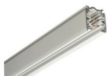
XTS 4200-1 GLOBAL Trac Pro Stromschiene 3-Phasen Aufbauschiene 2000mm - silber XTS 4200-1