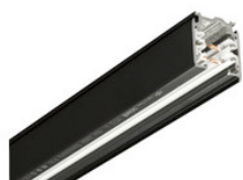
XTS 4200-2 GLOBAL Trac Pro Stromschiene 3-Phasen Aufbauschiene 2000mm - schwarz XTS 4200-2