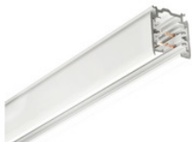
XTS 4300-3 GLOBAL Trac Pro Stromschiene 3-Phasen Aufbauschiene 3000mm - weiss XTS 4300-3