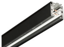
XTS 4300-2 GLOBAL Trac Pro Stromschiene 3-Phasen Aufbauschiene 3000mm - schwarz XTS 4300-2