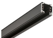
25-202 EUTRAC Stromschiene 3-Phasen Aufbauschiene 2000mm - schwarz 25-202