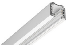
25-206 EUTRAC Stromschiene 3-Phasen Aufbauschiene 2000mm - weiss 25-206