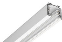
25-206 EUTRAC Stromschiene 3-Phasen Aufbauschiene 2000mm - weiss 25-206