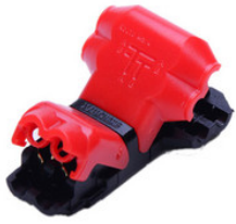
AA1100235 T-Draht Schnellverbinder für stripCENTURY AA1100235