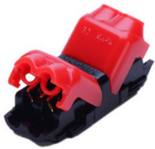
AA1100236 I-Draht Schnellverbinder für stripCENTURY AA1100236