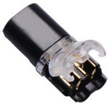
AA1100237 Feedconnector für stripCENTURY AA1100237