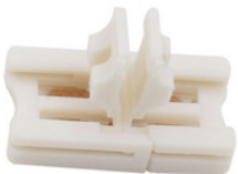
AA1100241 Verbinder Leiterplatte zur Leiterplatte für stripCENTURY 10 und stripCENTURY 12, 8mm, 30-120 LED pro Meter AA1100241