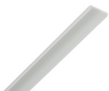
AA11642 PMMA Abdeckung für stripPROFILE 1/2/3/4 AA11642