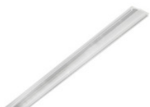
AA11641 PMMA Abdeckung für stripPROFILE 1/2/3/4 AA11641