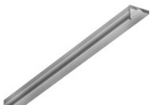
AA11639.01 LED stripPROFILE 5 Profil für LED Flexband AA11639.01