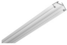
AA11634.01 LED stripPROFILE 4 Profil für LED Flexband AA11634.01