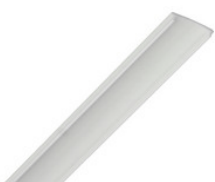
AA11645 PMMA Abdeckung für stripPROFILE 1/2/3/4 AA11645