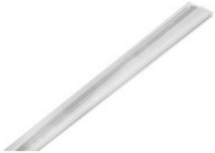
AA11641 PMMA Abdeckung für stripPROFILE 1/2/3/4 AA11641