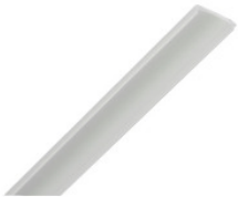
AA11642 PMMA Abdeckung für stripPROFILE 1/2/3/4 AA11642