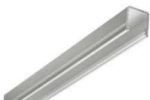
AA11626.01 LED stripPROFILE 2 Profil Aufbau U-Profil für LED Flexband - silber B=17 x H=18 x L=2020mm AA11626.01