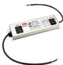
ELG-200-24A-3Y MEAN WELL LED Treiber Konstantspannung ELG-A 100-305V AC, 140-430V DC/ 24V DC 201W ELG-200-24A-3Y