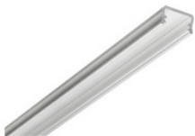
AA11620.01 LED stripPROFILE 1 Profil Aufbau U-Profil für LED Flexband silber B=16 x H=9,3 x L=1000mm AA11620.01