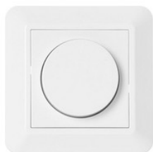
AA1100183 ZigBee Dimmer 250W, für roundCENTURY 360 und roundCENTURY 362 AA1100183