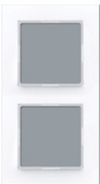
AA1100163 2-fach Aufbaurahmen für FFECT Programm AA1100163