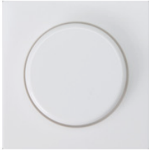
AA1100161 Zentralplatte mit Drehknopf für FFECT Programm AA1100161