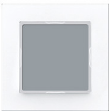
AA1100162 1-fach Aufbaurahmen für FFECT Programm AA1100162