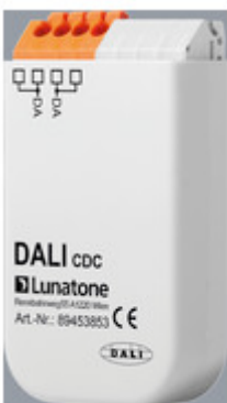
AA1100164 DALI CDC für FFECT Programm AA1100164