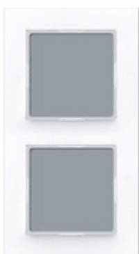
AA1100163 2-fach Aufbaurahmen für FFECT Programm AA1100163