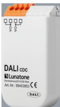
AA1100164 DALI CDC für FFECT Programm AA1100164