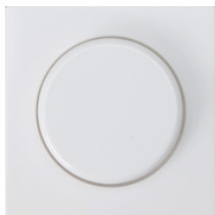
AA1100161 Zentralplatte mit Drehknopf für FFECT Programm AA1100161