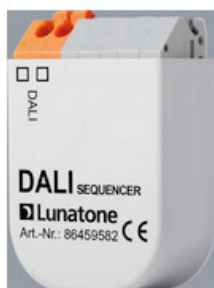
AA1100165 DALI Sequencer für FFECT Programm AA1100165