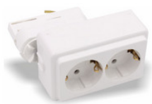
AA1100178 Universal 2er Schuko Steckdose, weiss für alle marktüblichen 3-Phasen Stromschienen AA1100178