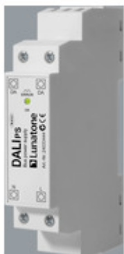
AA1100167 DALI PS1 für FFECT Programm AA1100167