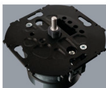
AA1100202 Wandsteuerung Einbau für FFECT Programm AA1100202