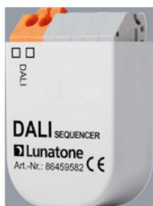
AA1100165 DALI Sequencer für FFECT Programm AA1100165