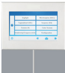
AA1100169 DALI Display 7" für FFECT Programm AA1100169