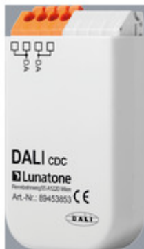
AA1100164 DALI CDC für FFECT Programm AA1100164