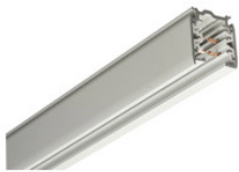
XTS 4200-1 GLOBAL Trac Pro Stromschiene 3-Phasen Aufbauschiene 2000mm - silber XTS 4200-1