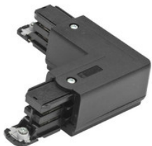
XTS 34-2 GLOBAL Trac Pro L-Verbinder für 3-Phasen Aufbauschiene, Schutzleiter innen, mit Einspeisemöglichkeit - schwarz XTS 34-2