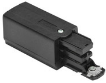
XTS 12-2 GLOBAL Trac Pro End-Einspeisung für 3-Phasen Aufbauschiene, Schutzleiter links - schwarz XTS 12-2