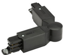
XTS 24-2 GLOBAL Trac Pro Eckverbinder für 3-Phasen Aufbauschiene, einstellbarer elektrischer Eckverbinder, 60°-300° - schwarz XTS 24-2