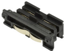
XTS 21-2 GLOBAL Trac Pro Verbinder für 3-Phasen Aufbauschiene, elektrischer Längsverbinder - schwarz XTS 21-2