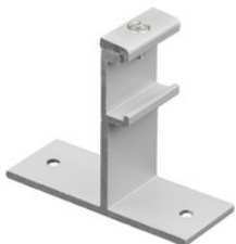
SKB 21-1 GLOBAL Trac Wandbefestigung zur direkten Montage mit Wanddistanz 70 mm - grau SKB 21-1