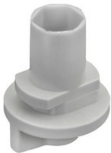
XTAK 142-1 GLOBAL Trac Pro Hakenträger für GLOBAL Trac Pro 2mm Stahlseil/Haken - grau XTAK 142-1