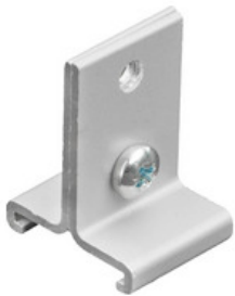
SKB 16-1 GLOBAL Trac Abhängeklammer für Seil- oder Pendelabhängung - grau SKB 16-1