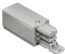
XTS 11-1 GLOBAL Trac Pro End-Einspeisung für 3-Phasen Aufbauschiene, Schutzleiter rechts - grau XTS 11-1