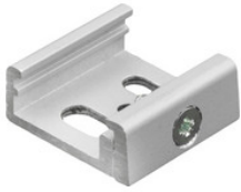
SKB 12-1 GLOBAL Trac Montageklammer für Deckenbefestigung oder Schienenabhängung - grau SKB 12-1