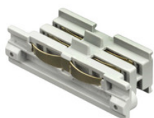
XTS 21-1 GLOBAL Trac Pro Verbinder für 3-Phasen Aufbauschiene, elektrischer Längsverbinder - grau XTS 21-1