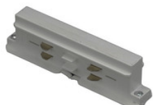
575 1 1206 8 EUTRAC Längsverbinder für 3-Phasen Aufbauschiene BASIC, grau 575 1 1206 8