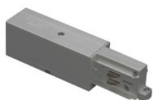
575 1 1201 8 EUTRAC Einspeiser für 3-Phasen Aufbauschiene BASIC rechts, grau 575 1 1201 8