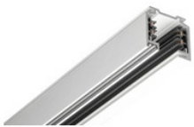
25-203 EUTRAC Stromschiene 3-Phasen Aufbauschiene 2000mm - silber 25-203