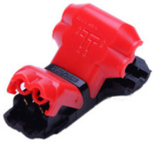
AA1100235 T-Draht Schnellverbinder für stripCENTURY AA1100235